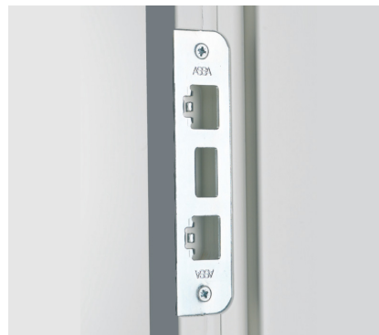
Slutbleck för Assa 310 låshus.