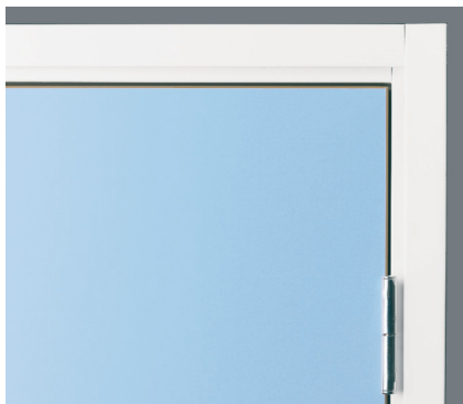
Skyddande kant runt om hela dörrbladet som både skyddar och gör det lätt att hålla rent.