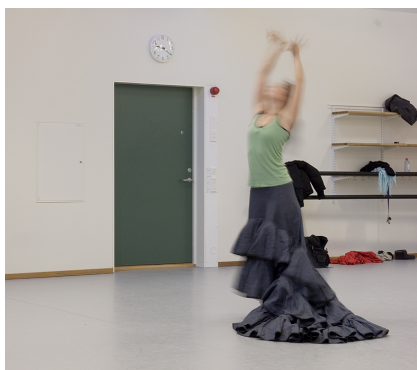
Ljuddörr i Danshögskolans lokaler