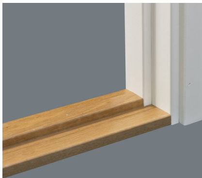
Tröskel av hårdträ.