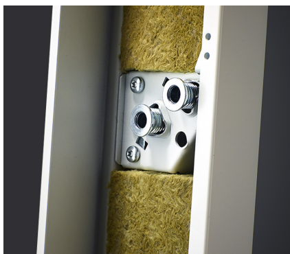
Fabriksmonterade efterjusterbara karmhylsor och färdigisolerad karm underlättar snabbt och säkert montage.