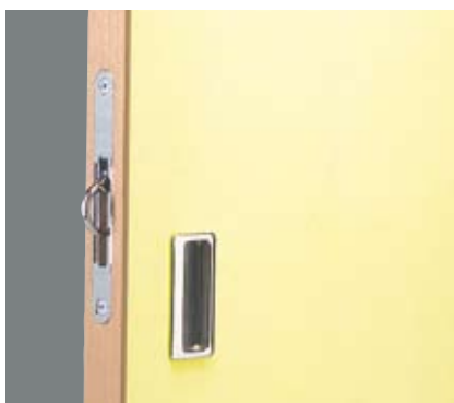
Infällt kant- och draghandtag.